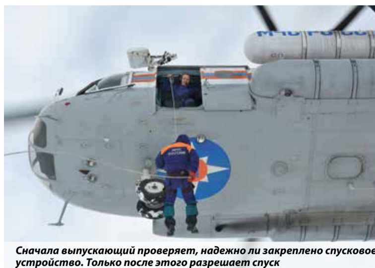
Сначала выпускающий проверяет, надежно ли закреплено спусковое устройство. Только после этого разрешает спуск

— Чрезвычайные ситуации невозможно предугадать, в большинстве случаев отсутствует возможность для посадки вертолета в зоне ЧС