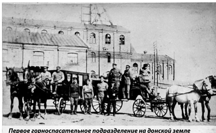
Первое горноспасательное подразделение на донской земле

Постановлением ВЦИК и Совета народных комиссаров РСФСР от 1922 года «О горноспасательном деле в РСФСР» была создана государственная профессиональная горно-