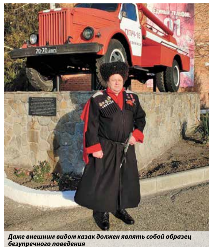
Даже внешним видом казак должен являть собой образец безупречного поведения

Рубрика с таким названием постоянно действует в аккаунтах ведомства в соцсетях. Но особенно актуальна она в День народного единства