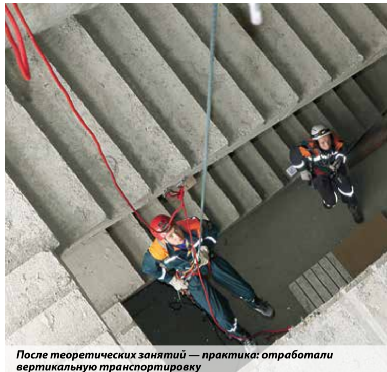
После теоретических занятий — практика: отработали вертикальную транспортировку