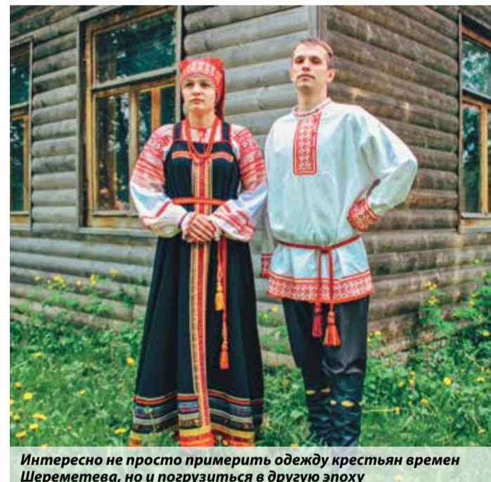
Интересно не просто примерить одежду крестьян времен Шереметева, но и погрузиться в другую эпоху