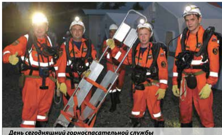
День сегодняшний горноспасательной службы

спасательная служба, которая начала бурно развиваться. Численность горноспасателей выросла в три раза.