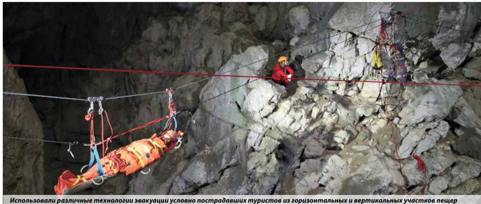
Использовали различные технологии эвакуации условно пострадавших туристов из горизонтальных и вертикальных участков пещер